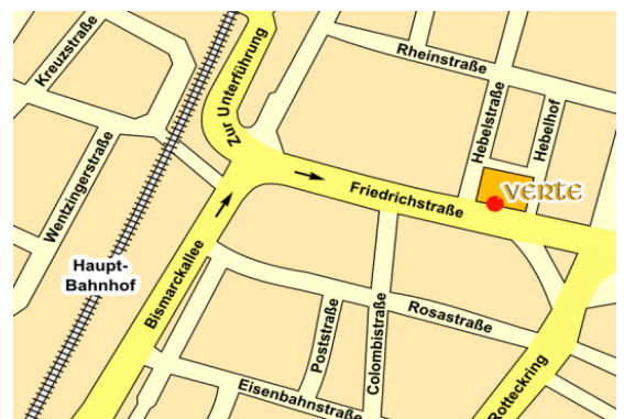
Nur 5 Minuten Fußweg vom Hauptbahnhof